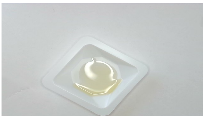
Bild der eingelangten Probe vom 12.05.2022